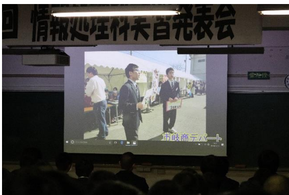
動画編集講座（市岐商デパート）