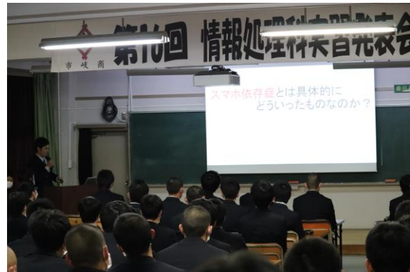
私の提言 (スマホ依存症について)