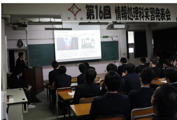
私の提言 (「アニメ」が与える社会への影響)