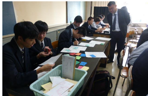
特別事業課の活動の様子