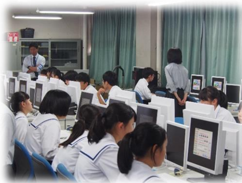
体験② コンビニ店長（模擬販売）