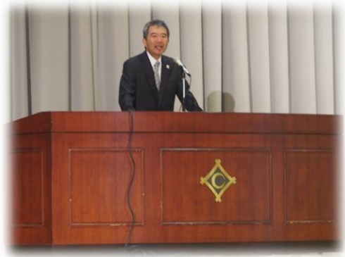
校長 入学許可・挨拶