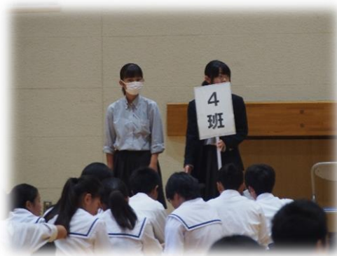
在校生による誘導