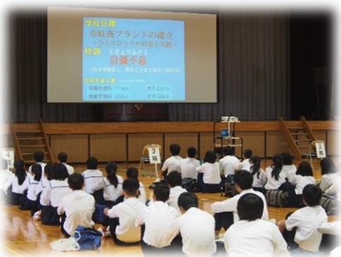
教務主任による学校説明