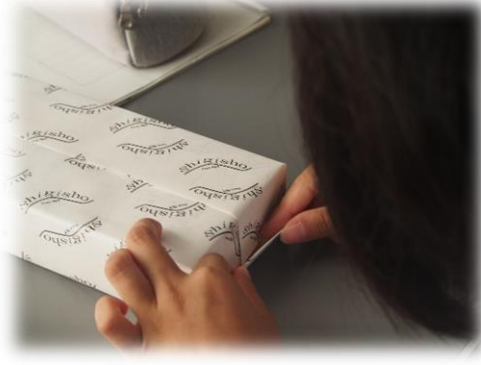
体験④ 商品のラッピング体験