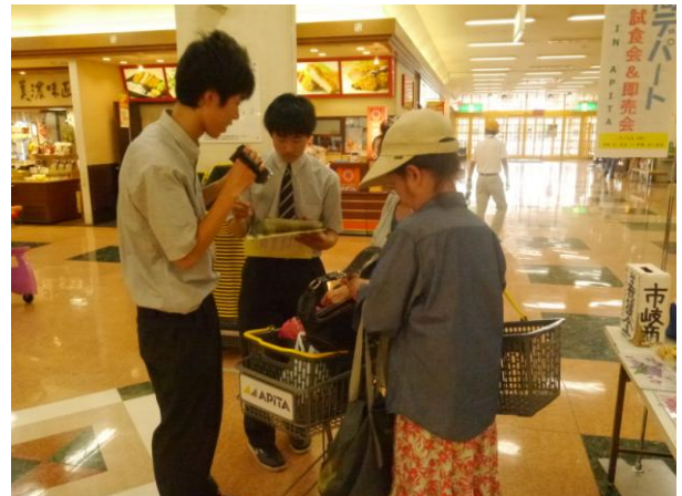
新商品のアンケートにもご協力いただきました