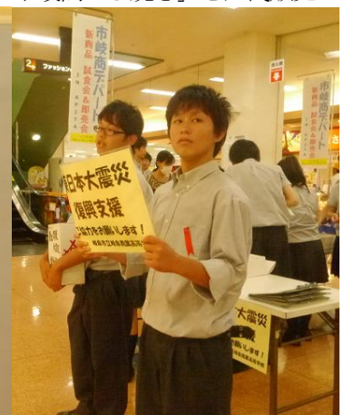
アピタ北方店のご協力により、試食販売PRポスターを準備していただきました 義援金活動も実施しました