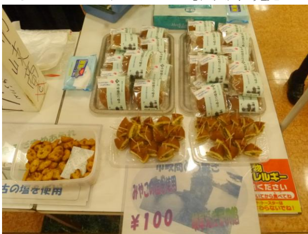
復興支援を目的としたコラボ商品の開発 宮古の塩と岐阜えだまめを使用した「市岐商どら焼き」を試食販売