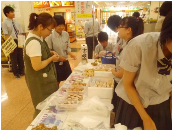
いちごとブルーベリーのぶっせも大人気で完売

試食販売と一緒に行った義援金活動では、35,564円の寄付金が集まりました。地域の皆様からお預かりした義援金は、宮古商業高校を通じ、復興支援（地域通貨リアスなど）のために活用していただきます。